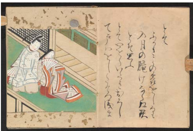
縦 6.0 cm × 横(片側)4.6 cm (見開き 9.2 cm)

室町後期から江戸時代前期に流行した奈良絵本に属する写本ですが、これだけ小さいものは珍しいです。「桐壺」「若紫」などから抜粋した文章に挿絵が添えられ、読む為ではなく、人形の飾りとする為の「雛本」に属するものかと思われます。本文も挿絵も、近時存在が明らかになった女流奈良絵本作者の居初(いそめ)つなの手によるものです。本書は、公家の三条西家の分家押小路の出である玄長(はるなが)を祖とする、徳川幕府高家の前田家に伝来したもので、5代将軍綱吉より拝領との伝承を有しており、書誌学的のみならず文化史的にも価値が高いものです。